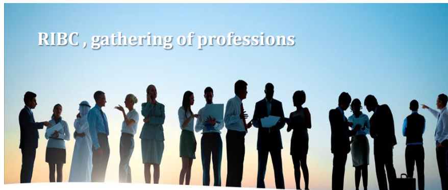
RIBC , gathering of professions

EIBA was established in 2005 to be the only recognized organization representing the insurance brokers in Egypt. In addition to be the centralized global insurance brokers' network which include Africa, Asia and Europe.